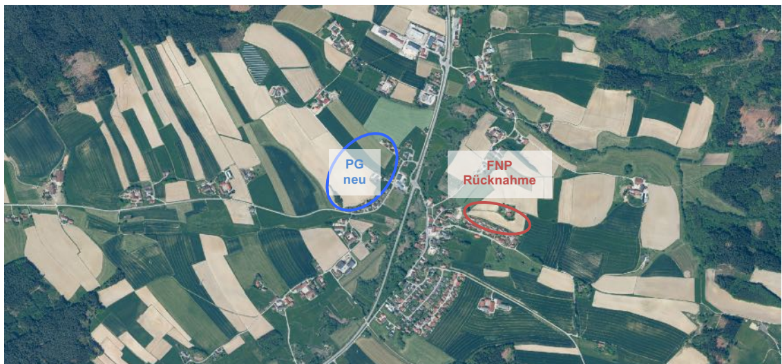
Luftbildausschnitt von Hirschhorn aus FIS-Natur Online des LfU, Geobasisdaten: © Bayerische Vermessungsverwaltung