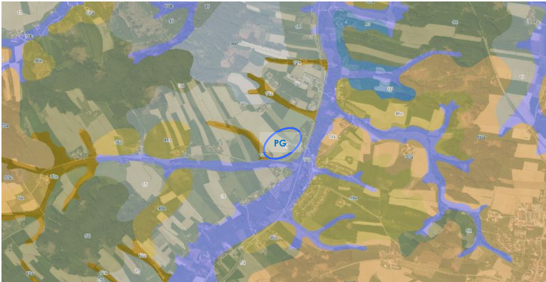
Abbildung des ÜBK25-Ausschnitts aus dem Fin-Web des Bayerischen Landesamts für Umwelt Geobasisdaten: © Bayerische Vermessungsverwaltung