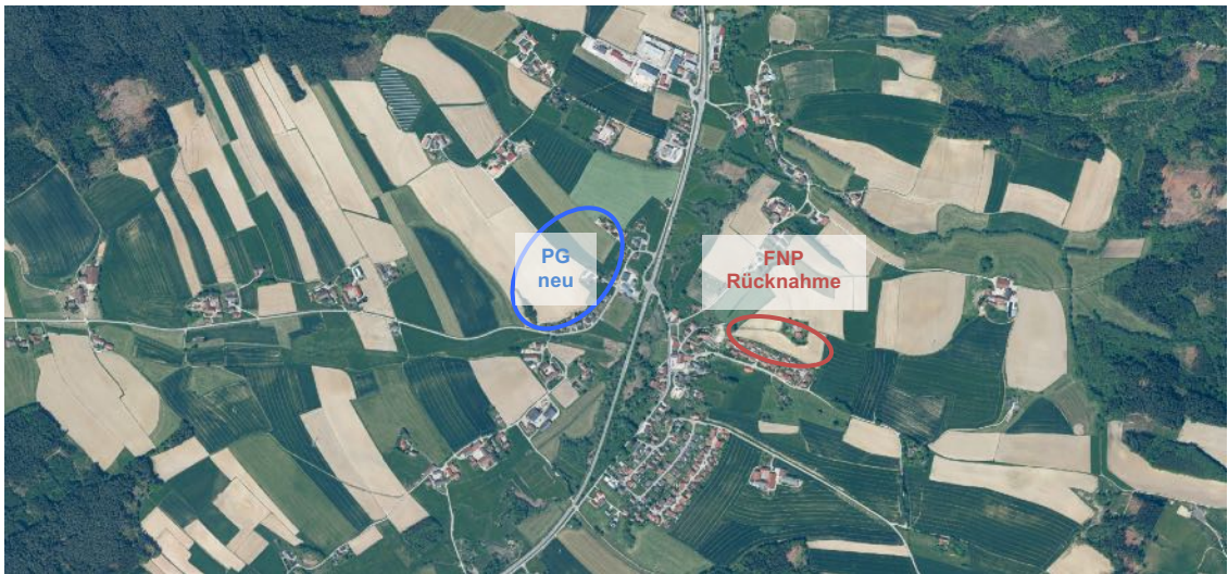
Luftbildauschnitt von Hirschhorn aus FIS-Natur Online des LfU, Geobasisdaten: © Bayerische Vermessungsverwaltung